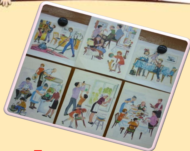
«Мама и детки» Дидактическая игра «Семья» «Большая семья»